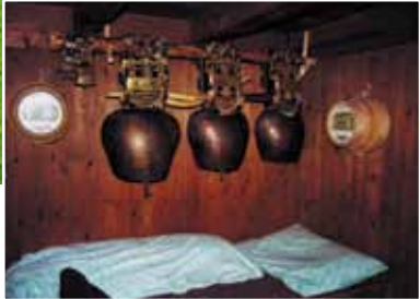
Die stachelige Ackerkratzdistel; Sennentumsschellen über dem Bett.